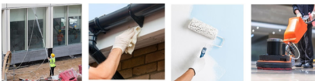
Limpieza en obras de construcción